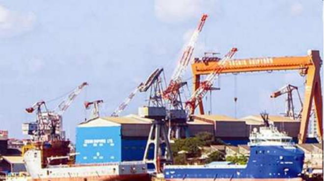
બ્લાસ્ટ બાદ ભારે અફઝાતફડી મચી ગઈ હતી. આગ ઉપર કાબૂ મેળવવાના તમામ પ્રયાસો થઈ રહ્યા છે. મૃત્યુ પામેલા લોકોની ઓળખ પણ કરવામાં આવી રહી છે. હજુ સુધી મૃતકોની ઓળખ થઈ નથી. બીજી બાજુ કોચિન શીપયાર્ડમાં બ્લાસ્ટને લઈને કેરળ સરકાર હચમચી ઉઠી હતી. વિરોધ પક્ષો દ્વારા સરકાર ઉપર આક્ષેપભાજીનો દોર પણ શરૂ કરી દેવામાં આવ્યો છે. શીપયાર્ડમાં જહાજોની રિપેરિંગ કામગીરી સતત ચાલતી રહે છે.

કોચી, તા. ૧૩ કેરળના કોચિન શીપયાર્ડમાં એક બ્લાસ્ટમાં પાંચ લોકોના મોત થયા છે. આ બ્લાસ્ટમાં અન્ય ૧૧ લોકો ઘાયલ પણ થયા છે. બીજી બાજુ બ્લાસ્ટ થયા બાદ ફાયરબ્રિગેડની ટુકડી તરત ઘટનાસ્થળે પહોંચી ગઈ હતી. આગ ઉપર કાબૂ મેળવવાના પ્રયાસ કરવામાં આવી રહ્યા છે. પ્રાથમ માહિતી મુજબ એક જહાજમાં રિપેરિંગ કામગીરી ચાલી રહી હતી ત્યારે એકાએક બ્લાસ્ટ થયો હતો. શીપયાર્ડમાં સતત ચાલતી રહે છે.