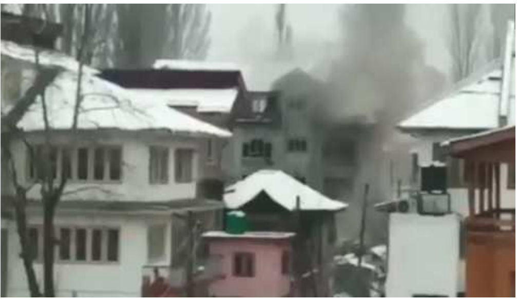
બેલ સમાન છે. ભારતીય સેનાના જવાનો સામે જઈને જંગ લડી રહ્યા છે. કારણ કે ત્રાસવાદીઓ સ્થાનિક વિસ્તાર અને વન્ય વિસ્તારમાં ક્યાં છુપાયેલા છે અને ક્યાંથી ગોળી આવી જાય તે કહી શકાય નહીં. સ્થિતિમાં ભારતીય લોકોના રક્ષણમાં રહેલા જવાનો સામે પ્રશ્ન કરવા અને શંકા કરવાની બાબત કોઈને પણ શોભા દેતી નથી.

ત્રાસવાદી હુમલો કરવામાં આવ્યો હતો. ઓપરેશન ઓલઆઉટ સેનાએ હાથ ધરીને ૨૦૦થી વધુ ત્રાસવાદીઓને મોતને ઘાટ ઉતારી દેવામાં આવ્યા બાદ ત્રાસવાદીઓમાં ભારે દહેશત ફેલાઈ ગઈ છે. જેથી ત્રાસવાદીઓ સેનાના જવાનો અને તેમના પરિવારના સભ્યો પર હુમલા કરી રહ્યા છે. દેશના તમામ લોકો સારી રીતે જાણે છે કે જમ્મુ કાશ્મીરમાં છેલ્લા કેટલાક સમયથી ઓપરેશન ઓલઆઉટ ચાલે છે. જેના ભાગરૂપે ત્રાસવાદીઓને શોધી શોધીને મોતને ઘાટ ઉતારી દેવામાં આવી રહ્યા છે. આ ઓપરેશન મોતના