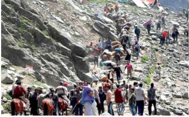
શ્રીનગર, તા. ૮ ઉપર મોટા ત્રાસવાદી હુમલાનો વાર્ષિક અમરનાથ યાત્રા ખતરો તોળાઈ રહ્યો છે. તોઈબા

અમરનાથ યાત્રાના સૌથી મહત્વપૂર્ણ હિસ્સા ચંદનવાડી, પહેલગામના રસ્તા પર ત્રાસવાદીઓએ રેકી કરી હોવાના અહેવાલ